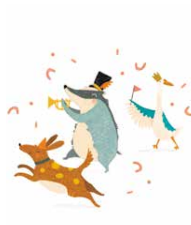
Illustratie: Vicky Lommatzsch