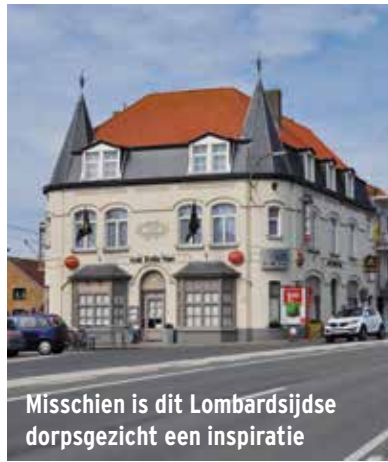
Misschien is dit Lombardsijdse dorpsgezicht een inspiratie