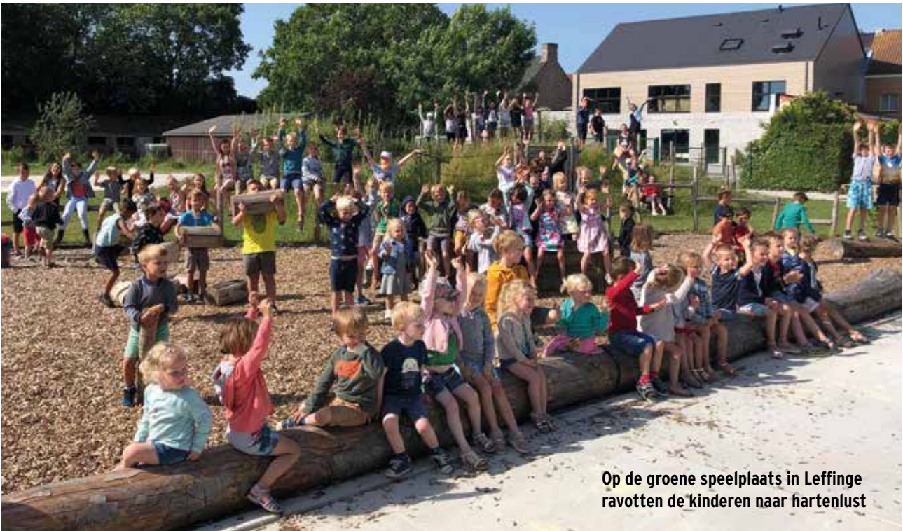
Op de groene speelplaats in Leffinge ravotten de kinderen naar hartenlust