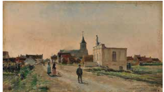
Schilderij van Louis Van Engelen uit 1880 met rechts de nieuwe vrije school.

Treffend voorbeeld van een gecontesteerde onteigening is die van is het café De Gouden Leeuw op de hoek met de Oostendelaan. Om het dorpsplein voor het gemeentehuis te vergroten. De café-uitbaatster eist een forse schadevergoeding en wijst boos het voorgestelde (lage) bedrag van de gemeente af: "Ik heb met verontwaardiging uw spotbrief ontvangen", schrijft ze bits. Ze moet voor de rechtbank verschijnen. Die kent haar een bedrag toe, dat ze in beroep nog weet te verhogen, maar uiteindelijk moet De Gouden Leeuw inbinden.