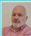
Jean-Marie Dedecker burgemeester